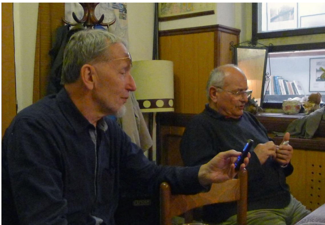
Job, Pegas - Mobily, jako nedílná součást dnešního společenského života